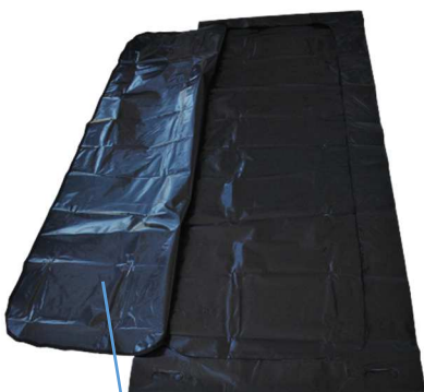
C - Reißverschluss