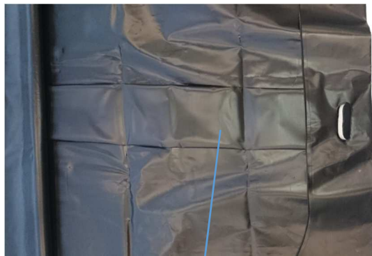
Boden doppelt verstärkt