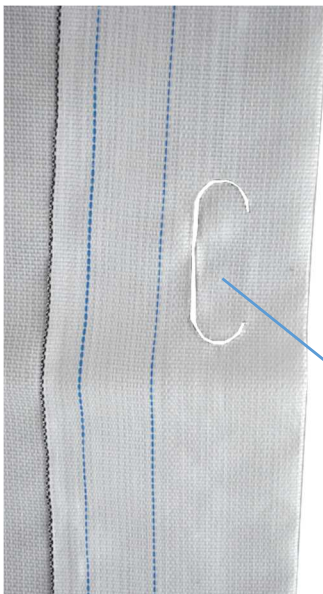
Tragegriffe gestanzt und Saum vernäht