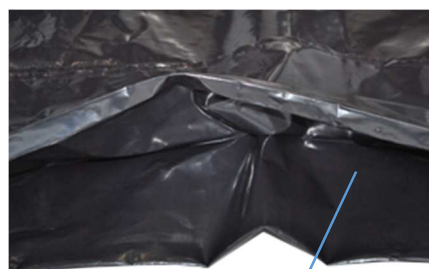
Reißverschluss & Seitenfalte