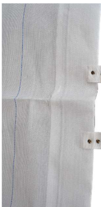
Trageschlaufen vernietet für mehr Stabilität